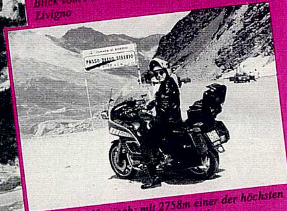
Auf dem Stilfserjoch: mit 2758m einer der höchsten Alpenpässe. Blick Richtung Umbrail