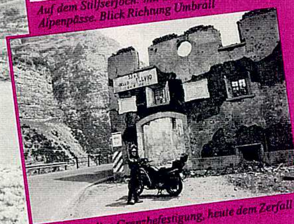
Eine ehemalige Grenzbefestigung, heute dem Zerfall preisgegeben