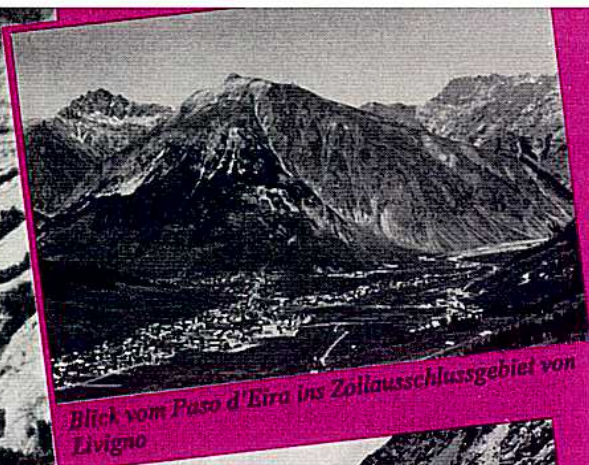
Blick vom Paso d'Eira ins Zollausschlussgebiet von Livigno