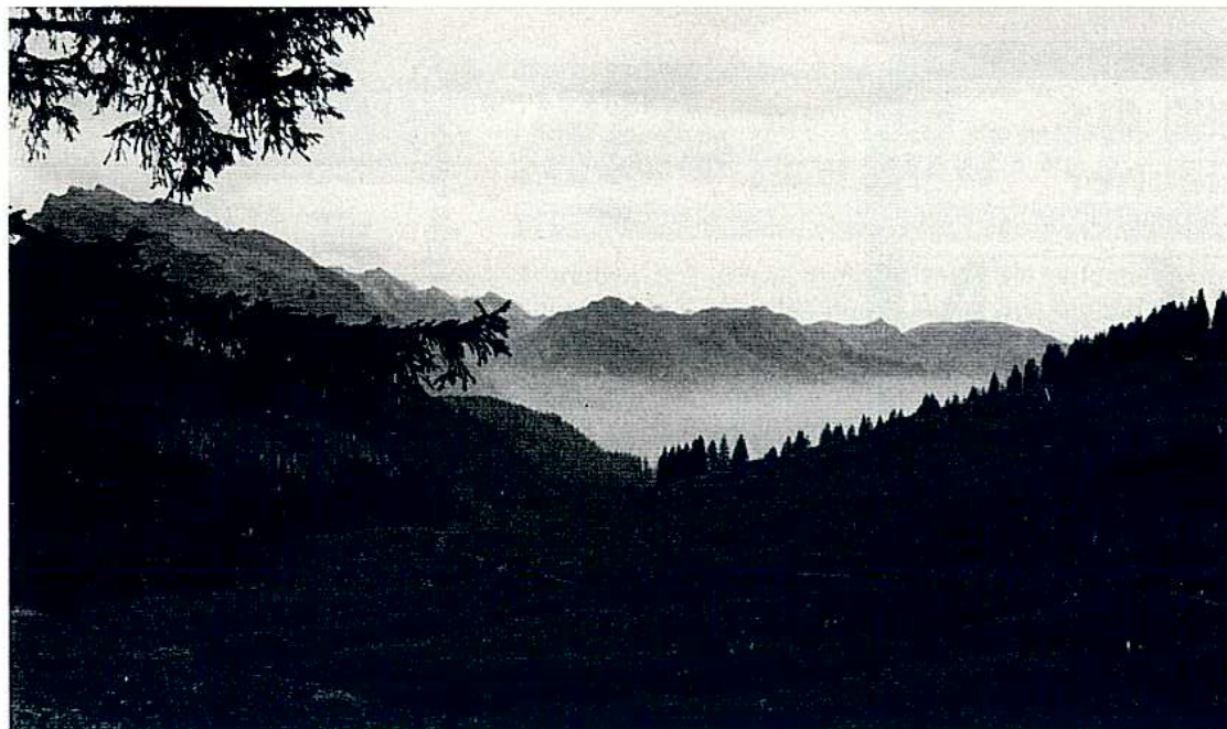
Wie in eine wundersame Welt blickt man vom Pragelpass Richtung Muotatal!