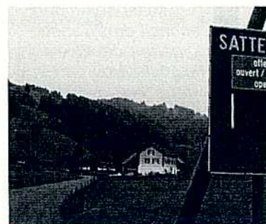
... und schliesslich noch über die Sattellegg