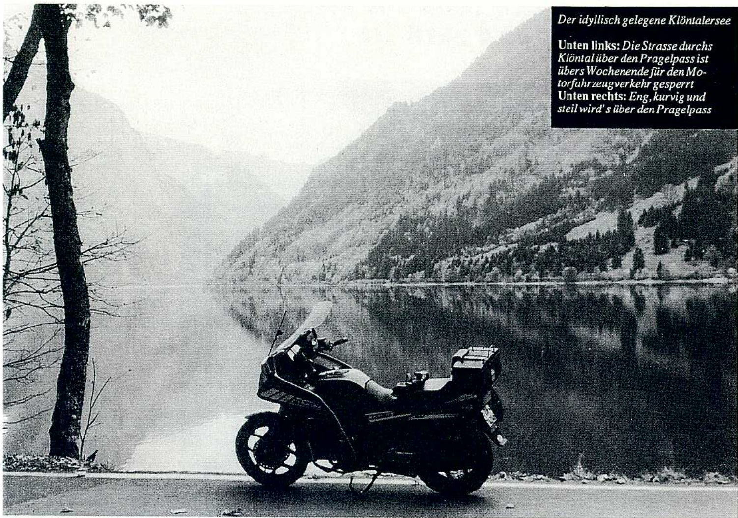
Der idyllisch gelegene Klöntalersee Unten links: Die Strasse durchs Klöntal über den Pragelpass ist übers Wochenende für den Motorfahrzeugverkehr gesperrt Unten rechts: Eng, kurvig und steil wird's über den Pragelpass